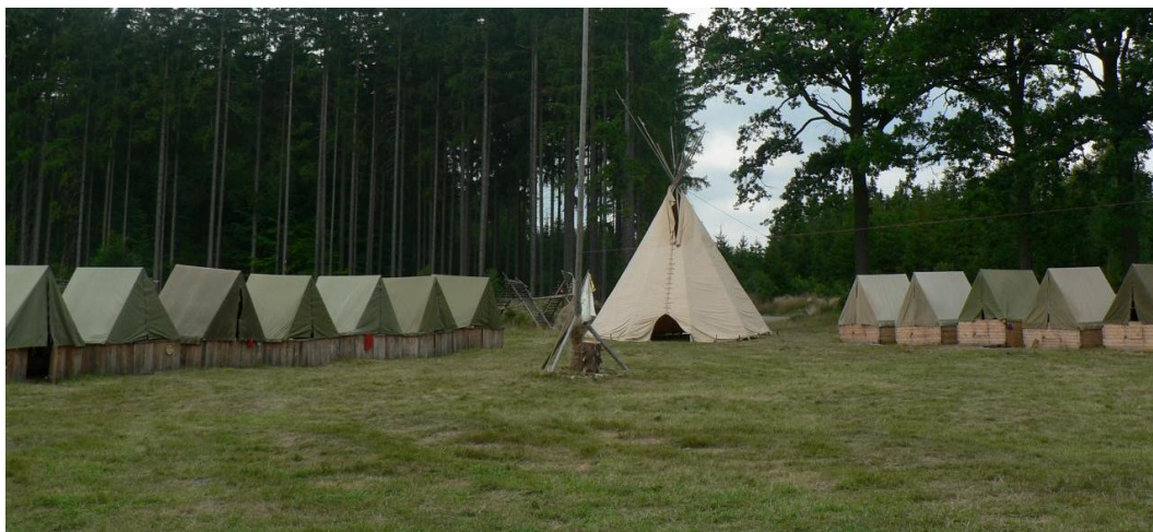
Louka se stožárem při táboru, pohled od hájovny