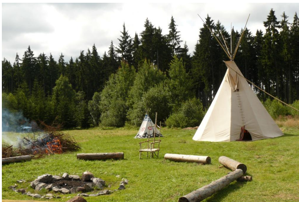
spodní louka s teepeem a tábořištěm