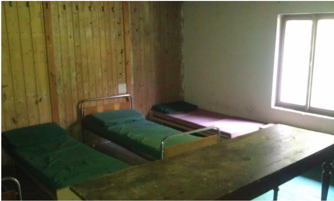
místnost na půdě bez kamen