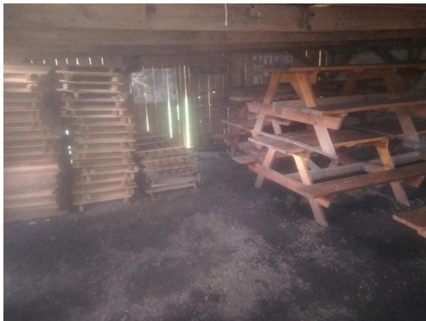
venkovní kuchyň (mimo léto, tj. když zazimováno)

Junák – český skaut, středisko Rožmitál p. Tř., z.s. se těší na Vaší návštěvu 😊