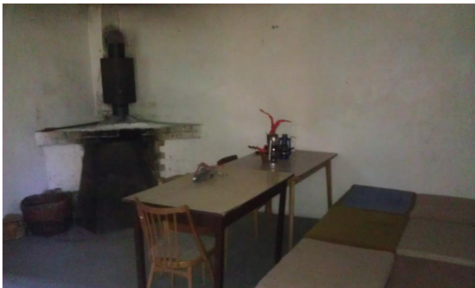
místnost s krbem